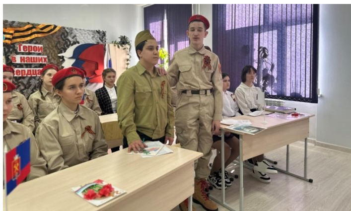
Рисунок 4. Сценка