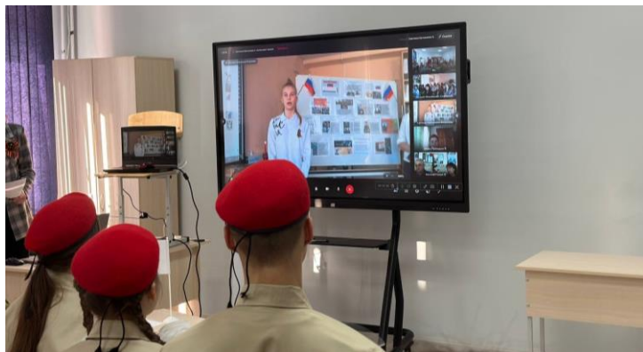
Рисунок 6. Выступление ребят из Челябинска

исполнении боевого задания. Награждён Орденом Мужества (посмертно). Я горжусь своим отцом!