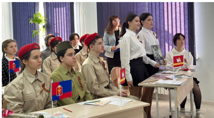
Рисунок 5. Выступление

4. Ведущий: Спасибо! Послушаем обучающихся из Челябинска.