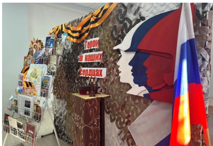
Рисунок 1. Оформление класса

Предлагается оформить баннер, на котором будут отображены с одной стороны символы Великой Отечественной войны, а с другой стороны - символы спецоперации.